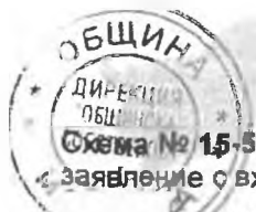
Схема № 15-581473-07.06.2024 г. издадена въз основа на заявление с входящ № 01-312956-07.06.2024 г.